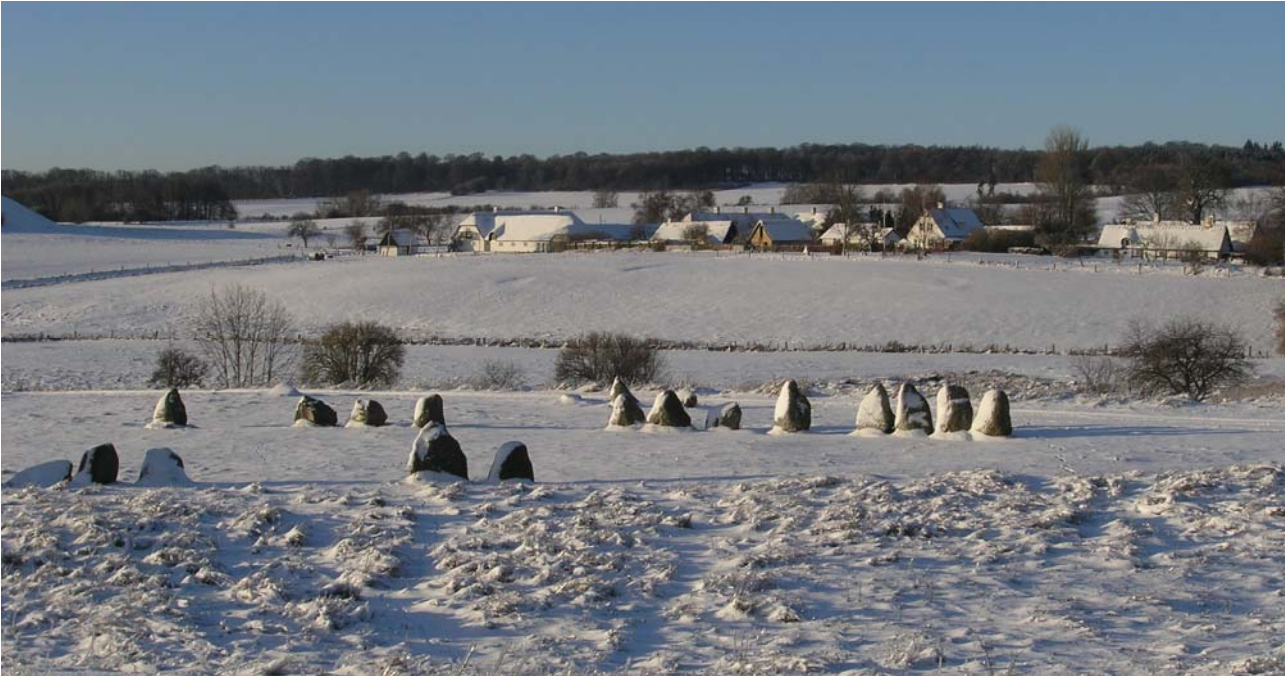
Skibssætningen med Gl. Lejre i baggrunden.