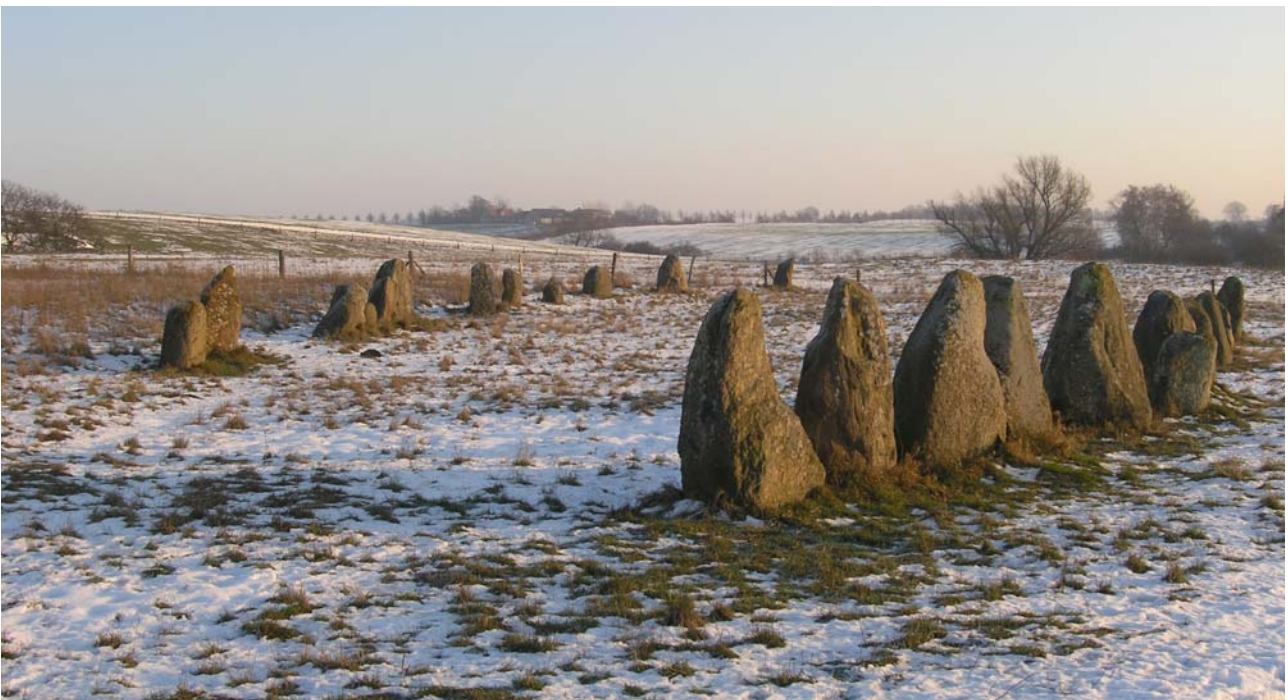
Skibssætningen med Alléen i baggrunden